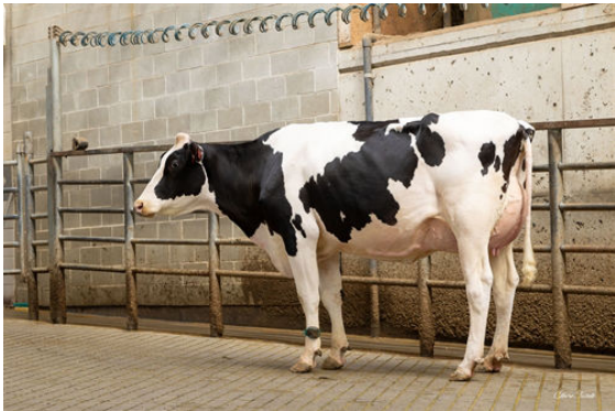
BEYOND HAYK HI-SPEED DAM